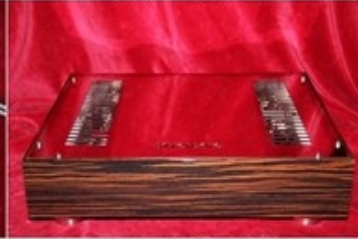
Silvercore Phono two