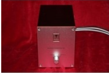
Kondo KSL SFZ