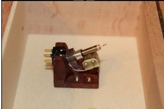
Van den Hul - Goldbel Stradivarius