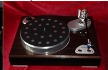
Acoustic Signature Triple X