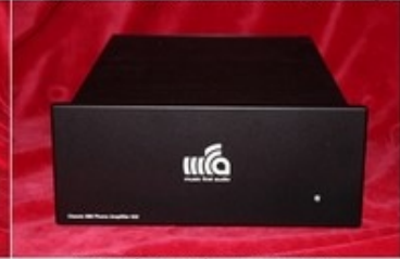
MFA Classic Phono AMP 632