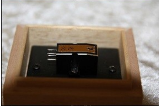
Korber - Black