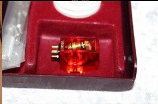
Benz - ACE I