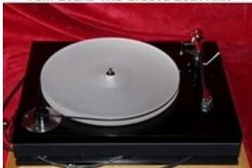
Bauer audio dps 3