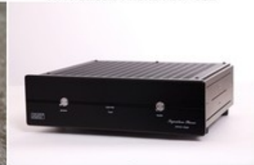
NAT - Signature Phono Vacuum RIAA