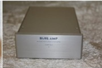
Blue amp model blue MKII