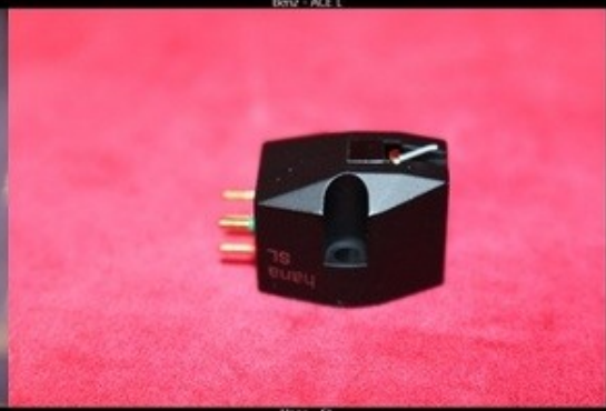
Hana - SL

So, das war es erstmal an Neuigkeiten aus Falkensee.