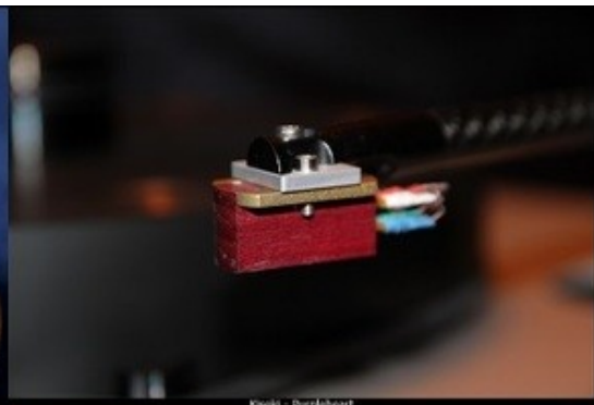
Kuehl - Purpleheart