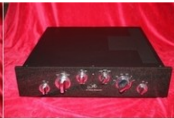
Audio Exclusiv P2