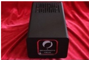
Grandinote - Celio