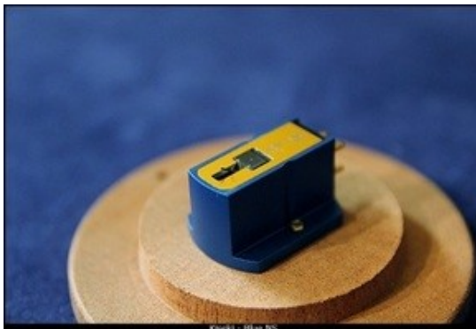
Kuehl - Blue IV