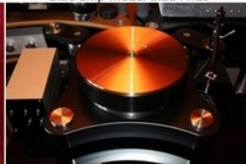
TW Acoustic Raven AC