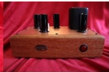
Tektron - TKPREMM MKII Phono Amp